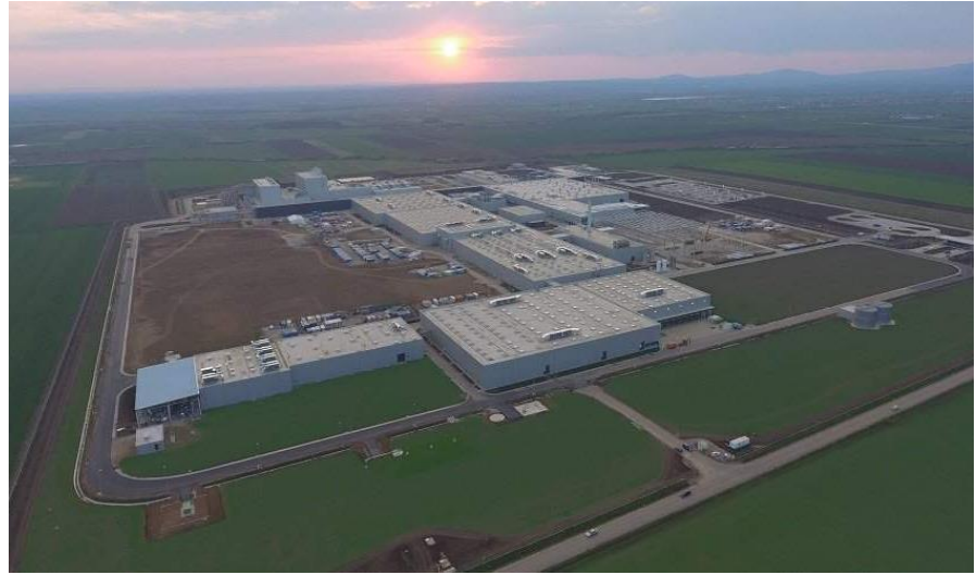
*Fábrica Gyöngyöshalász (Hungría)

La empresa cuenta ahora con cinco unidades de fabricación en la India, una en los Países Bajos y otra en Hungría.