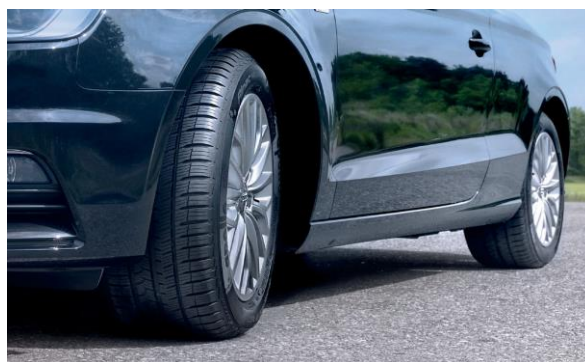
ALL SEASON /WINTER