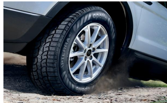
SUV / 4X4